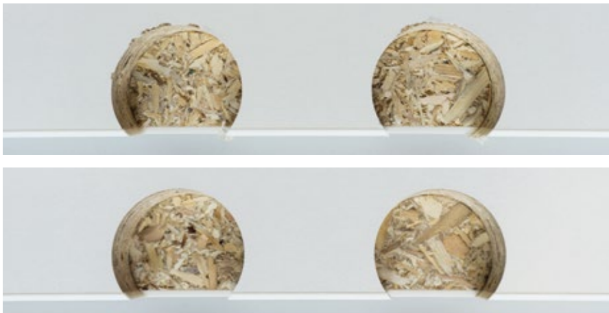
Bild oben: Randbohrungen für Topfbänder mit herkömmlichen Beschlaglochbohrern.