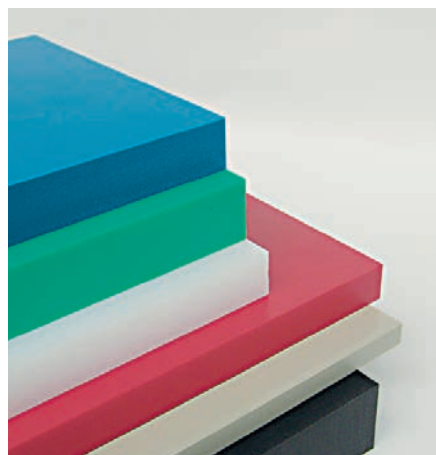
Planfräser HeliPlan: Nahezu riefenfreie Oberflächenqualität beim Abplanen von Opferplatten (links), sowie Oberflächen in Finishqualität bei thermoplastischen Kunststoffplatten (rechts).